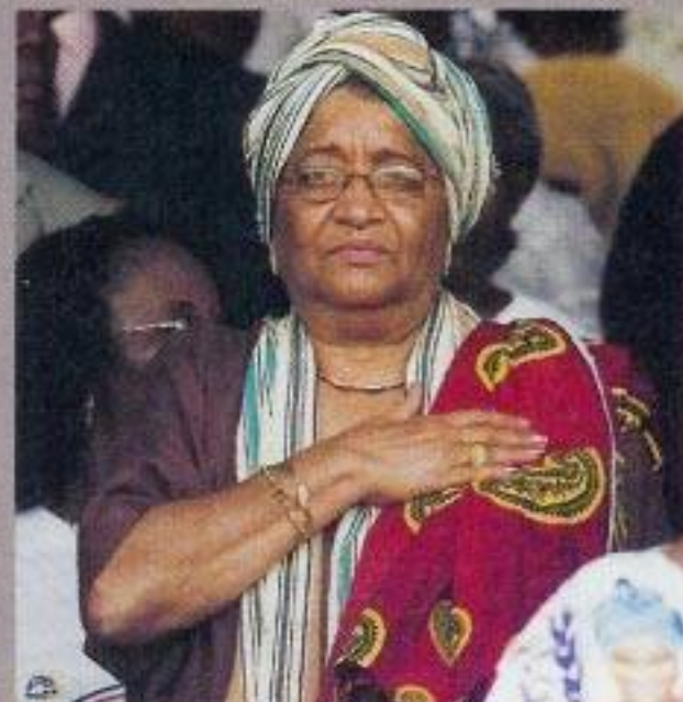
FEIRER: Ellen Johnson-Sirleaf har vært Liberias president i et år.

– Når arbeidsledigheten er på 85 prosent, hvem bryr seg da om kvaliteten på skolene.