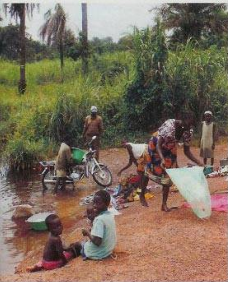
INGEN SKOLE: En tredjedel av alle skolene i Liberia er fortsatt stengt. Disse barna vasser så lenge.

– Deres selvfølelse smuldrer sakte, men sikkert bort, sier Casal.