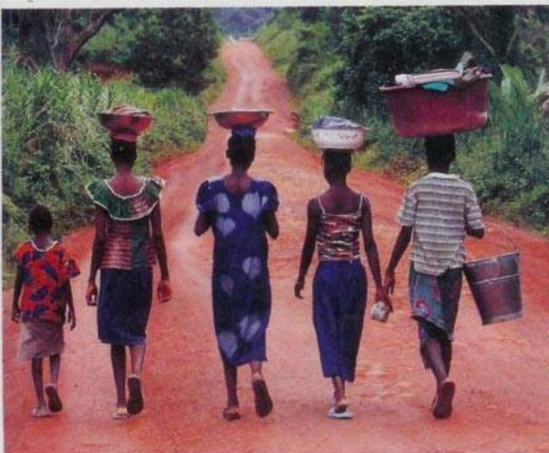
JOBBER: Det hender de liberiske jentene i guineanske flyktningeleire tyr til prostitusjon for å finansiere skolegangen. Her fra Kola leir.